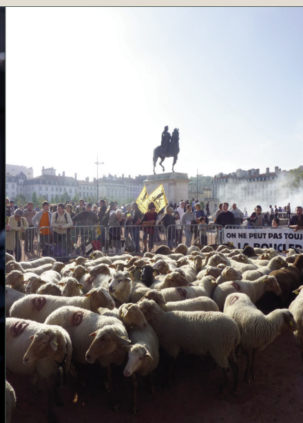
Transhumance urbaine à Lyon le 24 octobre 2013.